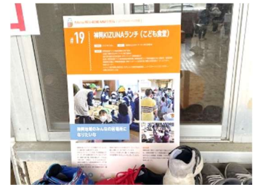
ウェルビーイング大賞で活動報告

事務局は神興小学校の米作り体験・ハッピーフェスタに参加しました。小学生とふれあい、楽しい時間を過ごさせていただき、ありがとうございました。