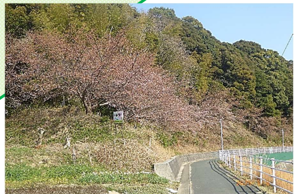
光陽台通学路の大漁桜 R7年3月9日撮影