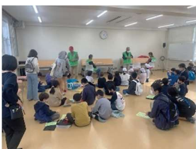
割りばし輪ゴム鉄砲作り