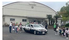
パトカー乗車体験