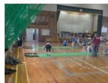
ニューススポーツ体験