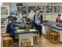
理科実験 ガリガリプロペラ・吹き玉